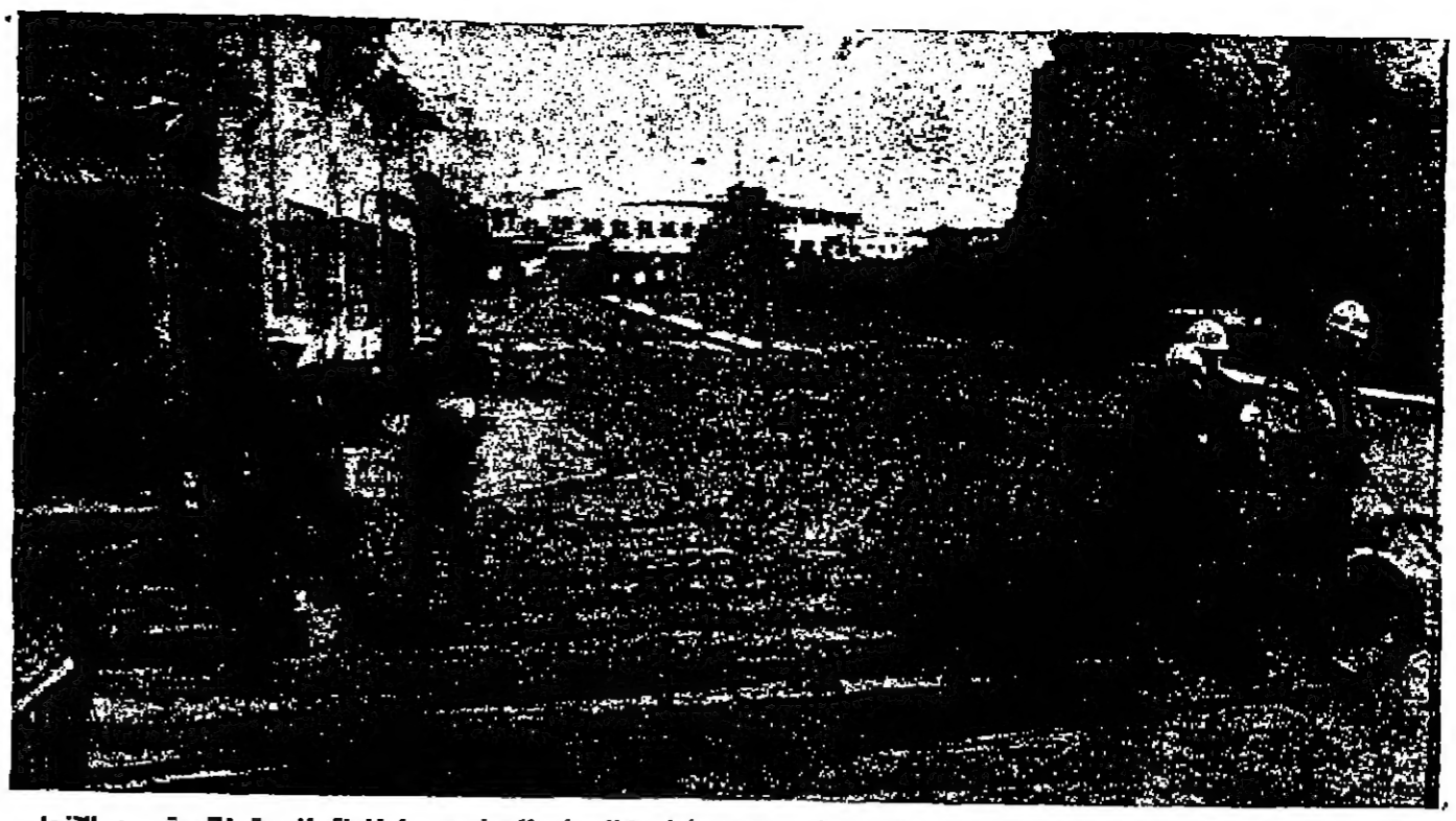
محلل باب العمود في القمم الأخرى معاداة بالباطة بيدو خالبا من الحياطة بعد فرضي نظم منع القبول على اللجنة العربية القومية بعد التجار الكبير يوم الجمعة الماضي

الجزائر - رويتر - ايمان هذا ان اسبوع تفكير السنين ومفاهيم فكرة القوم سياتر ويستخصص الاسبوع لخدمة تحرير الوطن الفلسطيني في ٧٠ فتح ١٤ خلال حملة تضامن جزائرية مع الشعب الفلسطيني تستمر اسبوعا اعتبارا من امس . وستكون القومية الفلسطينية وبعثة القوم قضية موضوع الضبط في جميع المساحات الجزائرية . وستلقى محاضرات عن فلسطين في جميع المدارس وسلاطح برامج خاصة من الراديو والتلفزيون . اجتماع طائري لاتحاد الأطباء العرب